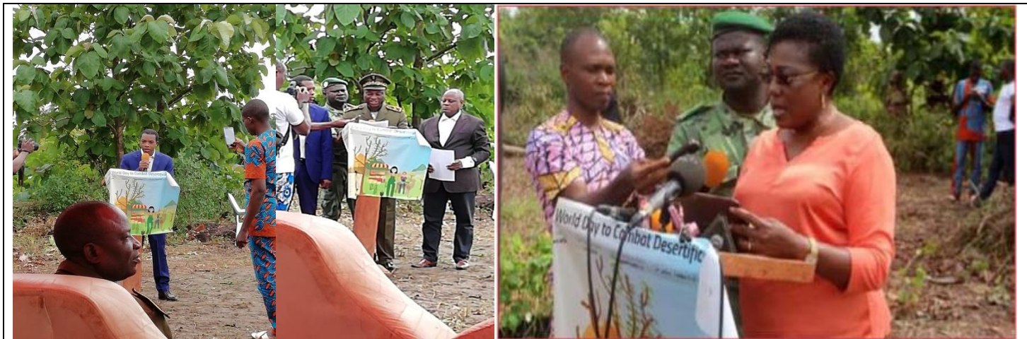
De gauche à droite, le Maire de la Commune de Djidja, le Préfet du Département du Zou et la Directrice de Cabinet du Ministre du Cadre de Vie et du Développement Durable (MCVDD)