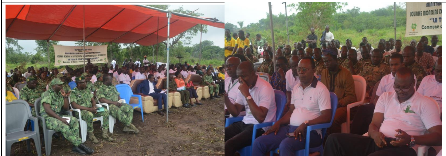
De gauche à droite, invités, les Directeurs généraux des secteurs de l'Environnement, de l'Agriculture et des Affaires Etrangères