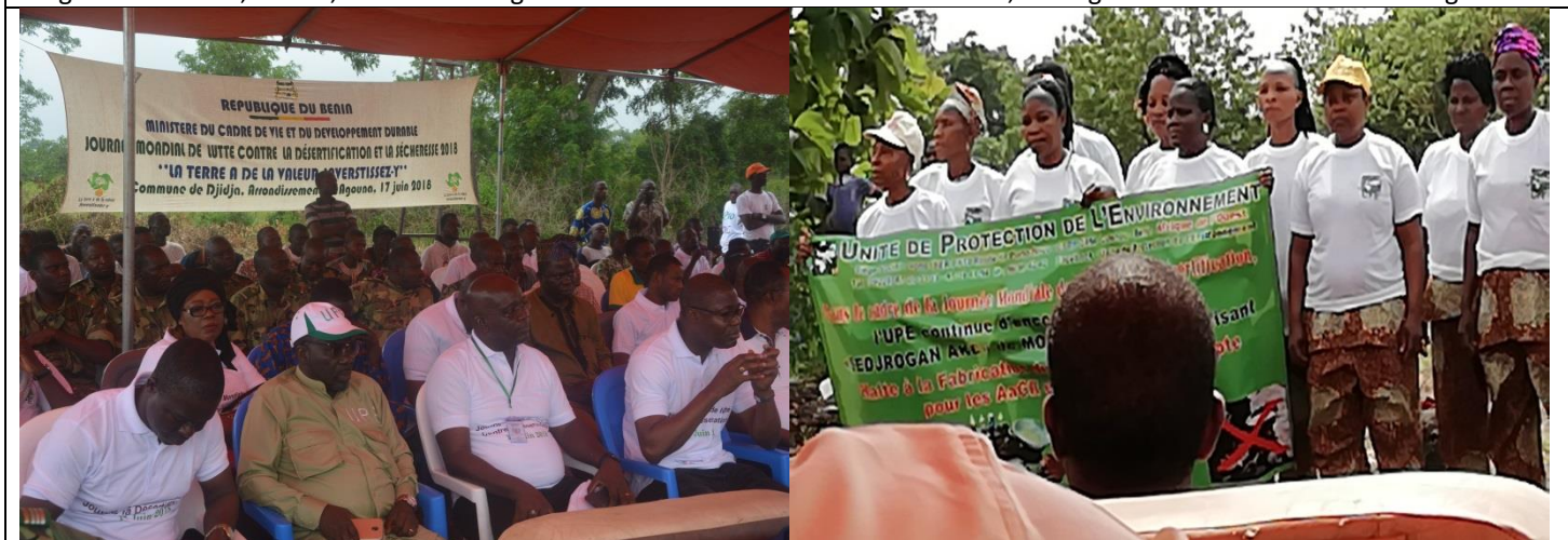
De gauche à droite, Représentant ProSOL/GIZ, Point focal, Directeur de l'UPE, Femmes de Djidja encadrées par l'UPE pour la substitution du gaz à la production du charbon de bois