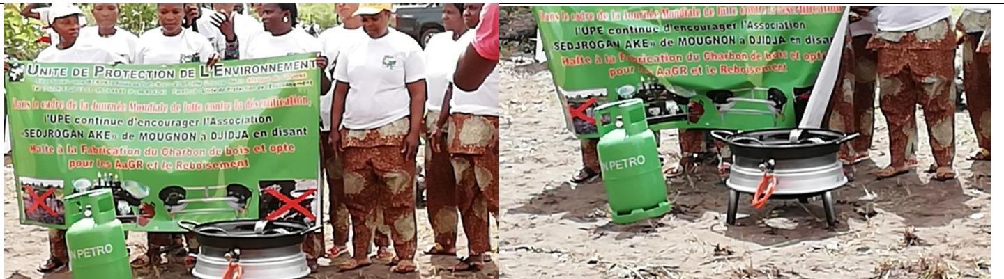
Lots composés d'une bouteille de gaz et d'un foyer amélioré (fabriqué à partir de jante de roue), donnés par le Directeur Général de l'Unité de Protection de l'Environnement (UPE) pour soutenir les femmes de Djidja