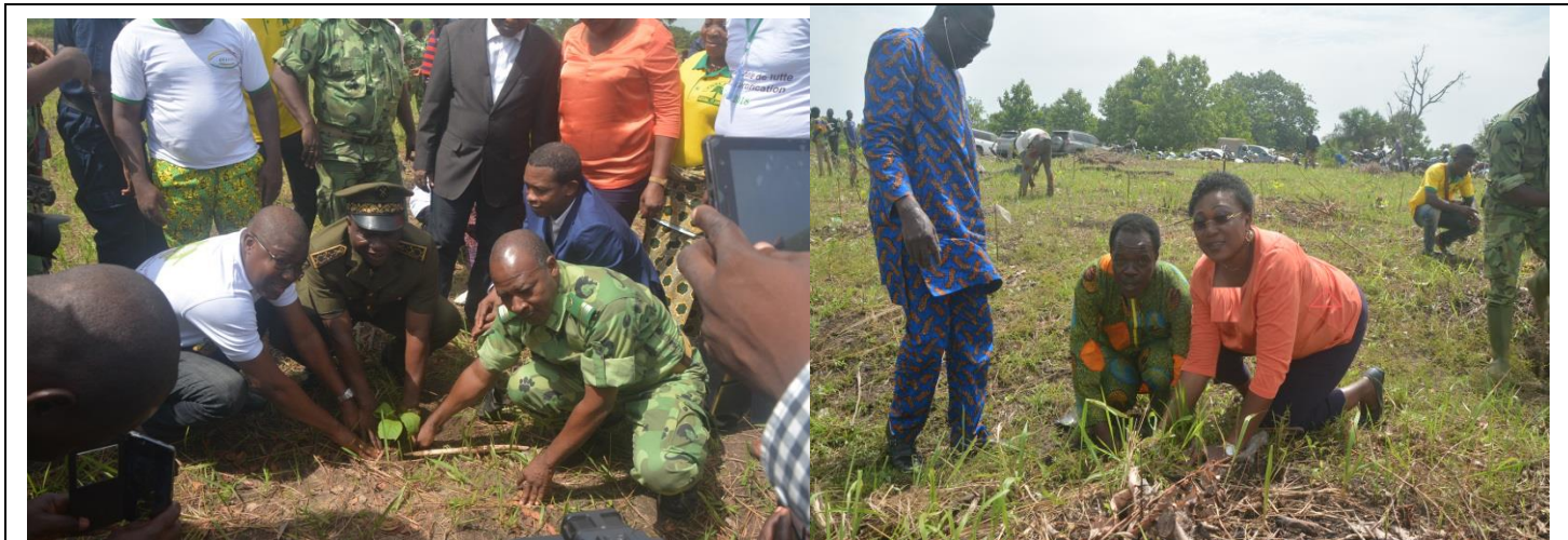
De gauche à droite, le Directeur du FNEC, le Préfet du Zou, le Maire de Djidja et la Directrice de Cabinet du MCVDD