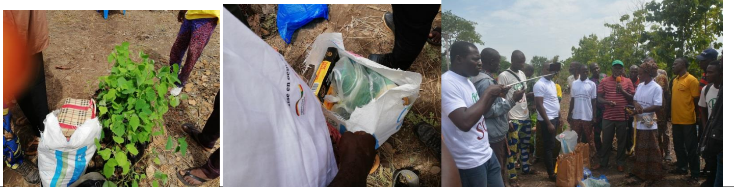
Lots (Décamètre de 50 m, Cordeau de 100 m, Plants pour clôture, Semence Aeschynomene, Scie à Main et bottes) donnés par le Projet Protection et Réhabilitation des Terres pour améliorer la sécurité alimentaire (ProSOL/GIZ) à une femme et un homme (chacun) sélectionnés comme meilleure agricultrice et meilleur agriculteur ayant adopté des mesures de GDT